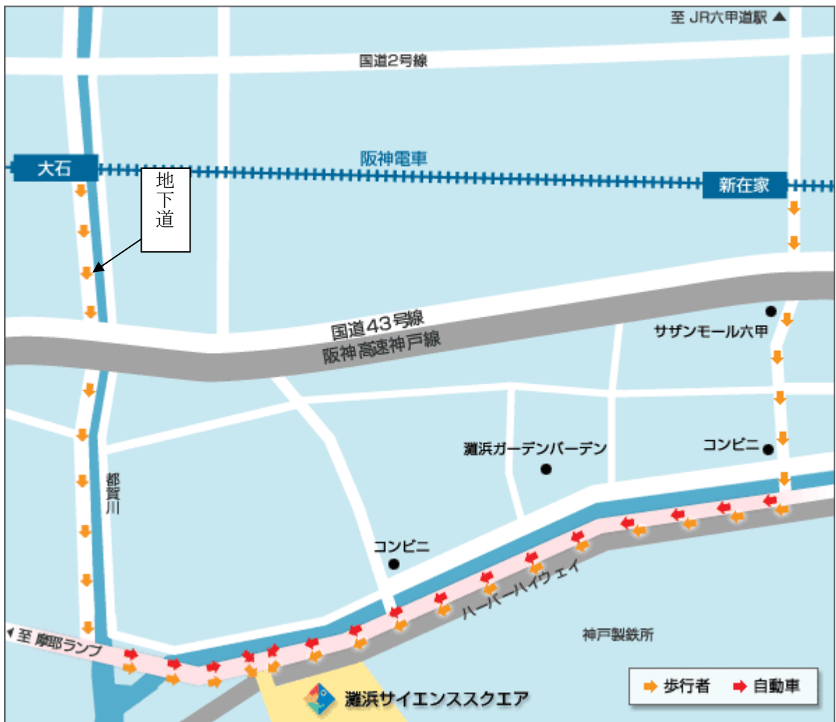
詳細な地図（阪神大石より）