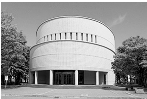
黒田講堂 1階会議室

* 構内には十分な駐車場スペースがございませんので、お車でのご入講は極力お控えください。